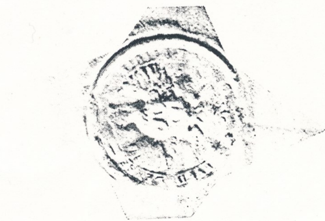
Afb. 3. Zegel 1693 - 1716