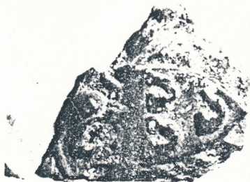
Afb. 1. Zegel 1346 - 1401