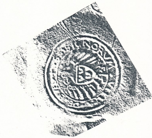
Afb. 2. Zegel 1596 - 1629