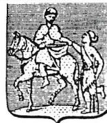
Het gemeentewapen 1819-1933

Waarom de gemeente pas op 10 no- vember 1819 in het bezit van het wa- pen werd bevestigd en niet op 16 juli 1817, zoals zovele andere, is niet bekend. Andere brieven buiten ge- noemde brief van 8 maart 1815 zijn immers niet bekend. Waarom het gemeentewapen van 1819 slechts de Heilige Martinus vertoont en niet het wapen Van der Clusen blijkt uit de afdruck die de burgemeester in 1815 toezond: deze was zo slecht dat iemand zonder kennis van de lokale situatie hier geen duidelijke afteke- ning van kon maken.