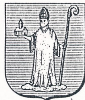
Het thans door de gemeente gevoerde wapen (1945-).