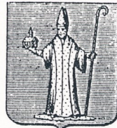
Het wapen uit 1818

Gekookte klimop kan men tegen verschillende ziektes aan het vee geven.