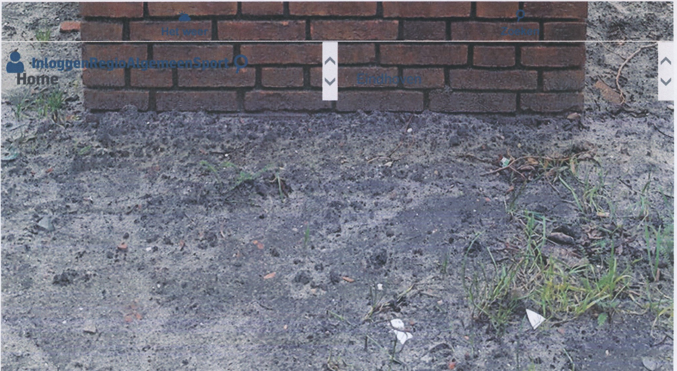
▲ Het bronzen wapen van Stiphout, dat eerder op het gebouw van de Rabobank hing.